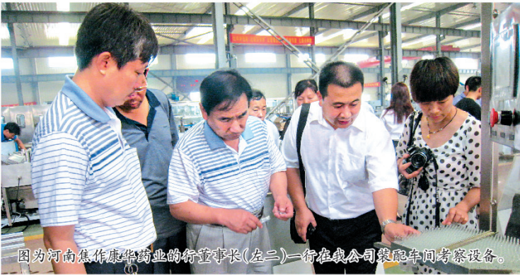
因为河南焦作康华药业的销售经理(左三)一行在我公司装配车间考察设备。