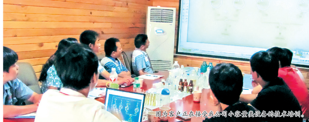
因为客户正在接收我公司小容量类设备的技术培训。

作为公众型的上市公司,千山药机越来越重视培训工作,这是企业发展进步的一个重要要素,也是企业长远战略发展的需要。培训能有效提升企业的人力资本,通过各种培训能形成最有效的途径,让员工更好地工作,迅速达成企业的发展目标。那么,目前千山的培训机制还存在哪些问题?培训能否真正解决实际问题?如何进一步完善培训机制以满足企业发展需要?让我们带着这些问题,走进本期话题,共同探讨千山究竟呼唤什么样的培训?